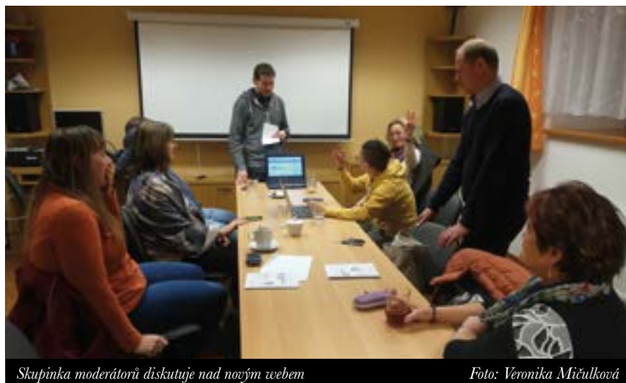
Skupinka moderátorů diskutuje nad novým webem