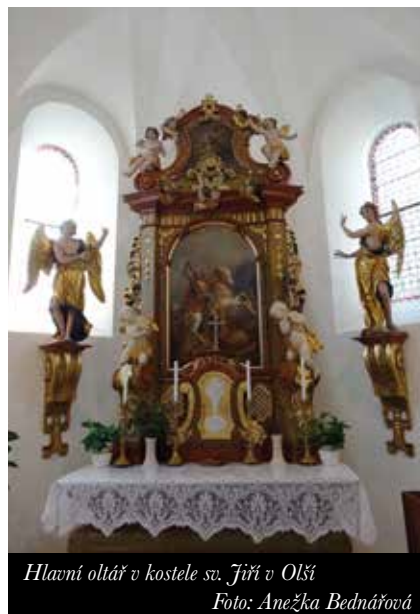
Hlavní oltář v kostele sv. Jiří v Olší