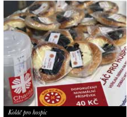
Koláč pro hospic

Hned první říjnovou sobotu jste podpořili charitní hospic na Tišnovských bleších trzích. Darovali jste nám spoustu věcí z vašich domácností, ale také jste si mnoho zajímavého za dob-