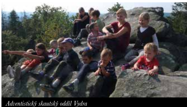
Adventistický skautský oddíl Vydra