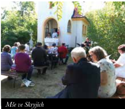
Mše ve Skryjích

Začátkem září slavily charitní služby ve Skryjích 10. výročí svého vzniku. Nezvykle krásné počasí nás provázelo během celého svátečního dne. Mše svatá pod širým nebem – před kaplí sv. Cyrila a Metoděje ve Skryjích, slavnostní oběd, milí hosté, příjemné odpolední posezení, živá hudba i nezapomenutelné vystoupení našich klientů – to vše vykouzlilo krásné zářijové odpoledne, které bylo odměnou všem, kteří se na vzniku a provozu služeb Chráněného bydlení a Sociální rehabilitace ve Skryjích podíleli nebo podílí. Chráněné bydlení v současné době poskytuje domov 11 klientům s lehkým a středně těžkým mentálním postižením, které po malých krůčcích provází běžnými denními činnostmi, aby tak dokázali vést co možná nejvíce samostatný život. A jednou třeba i zcela samostatně žít, pouze za dohledu ambulantní služby.