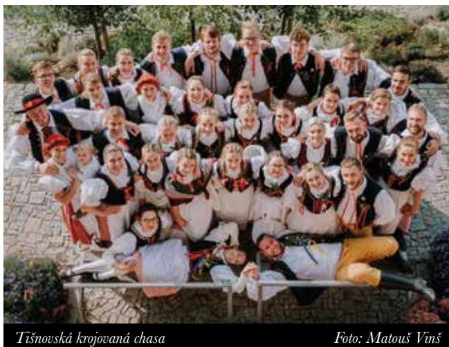
Tišnovská krojovaná chasa

Letošní Svatojáclavské hody se nesly v duchu velkého nadšení a radosti. Uplynulý „covidový rok“ nám zrušil ty minulé, a tak jsme je slavili po dvou letech. I přes nejistotu, zda nám epidemie opět neznamená konání hodů, se náš tým dal na jaře do práce. Proč tak brzo? Je totiž potřeba s předstihem zajistit prostory, kapelu anebo švadlenu, které se nám postarají o rozšíření počtu, případně opravu tišnovských krojů. Každý rok se nám více rozrůstá základna krojovaných, od těch nejmenších, přes svobodné