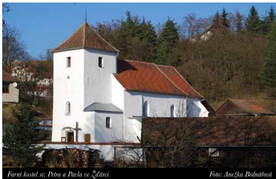
Farní kostel sv. Petra a Pavla ve Žďárci

Život všech tří farností je velmi pestrý a částečně se prolíná. Společným