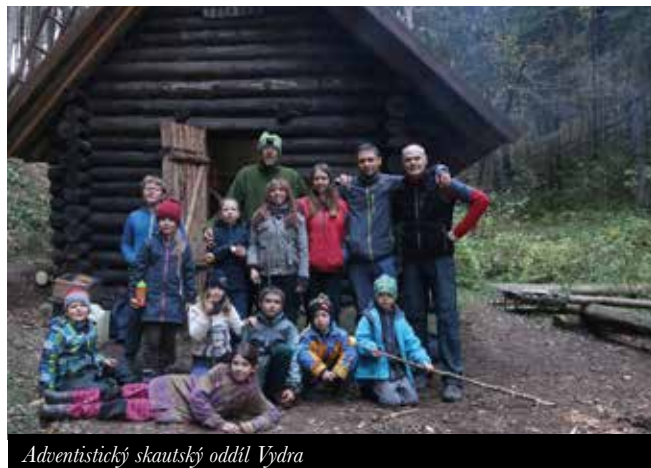
Adventistický skautský oddíl Vydra