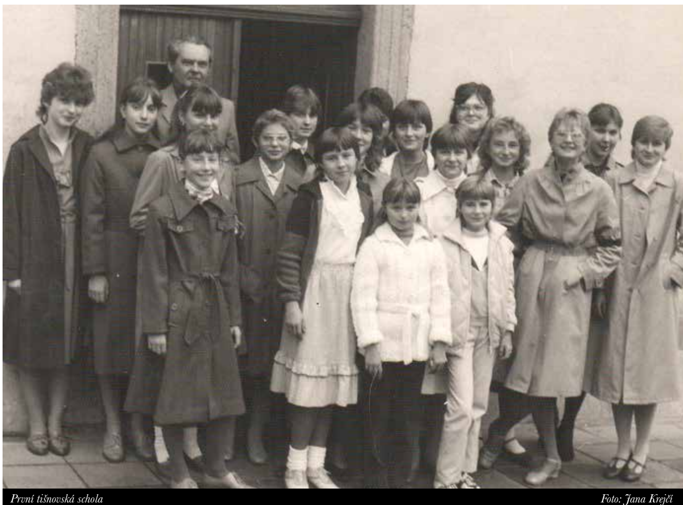
První tišnovská schola