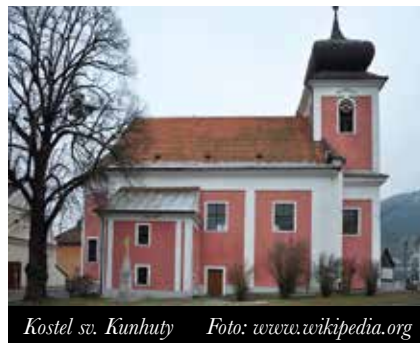
Kostel sv. Kunhuty

V neděli pan farář pravidelně zpovídá půl hodiny přede mší svatou,