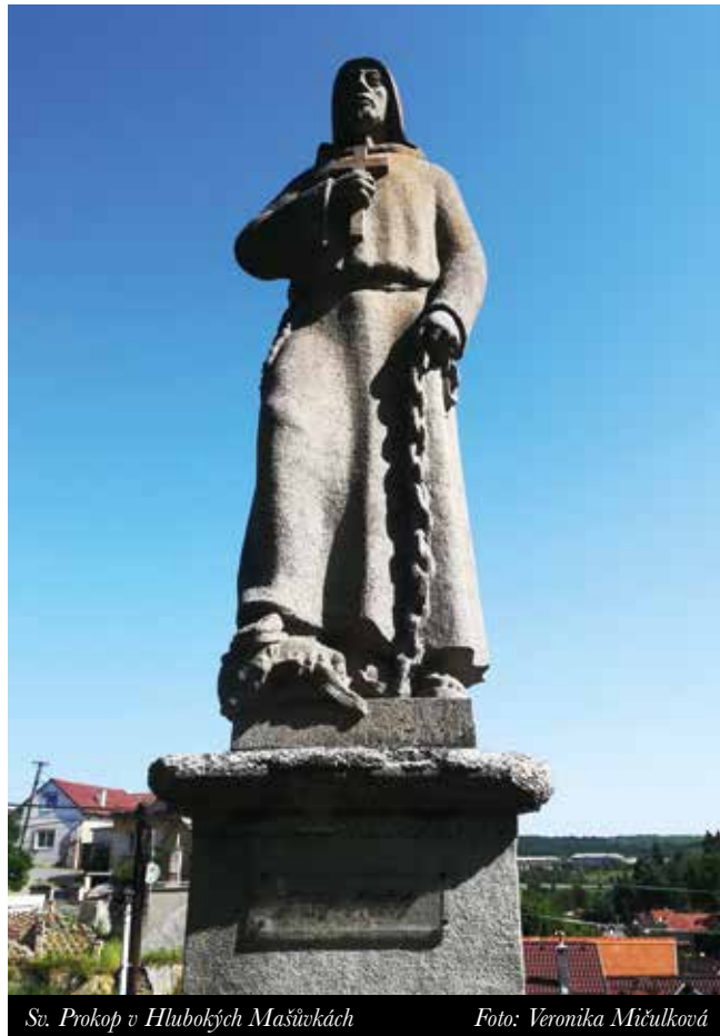
Sv. Prokop v Hlubokých Mašůvkách