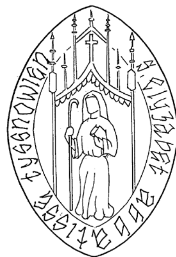
Pečeť abatyše Alžběty IV.

Obnova kláštera nebyla vůbec snadná. Rady sester jistě velmi prořídly a chrám i klášterní budovy byly silně poničeny husitským plněním i drancováním šlechty. Hospodářská situace a politické poměry byly složité a umožňovaly pouze pozvolné tempo oprav. I když dalších deset let o klášteře nemáme žádné zprávy, můžeme předpokládat, že tato léta byla naplněna usilovnou prací abatyše a konventu na obnově. V roce 1447 zahájila abatyše dlouhou bitvu o zpětné získání klášterních práv jak od duchovenstva, tak především od šlechty, která stále neprávem držela a využívala klášterní majetky, bez ohledu na Albrechtovu listinu. V uvedeném roce povolal papežský auditor k církevnímu soudu do Říma tišnovského faráře Jana z Věže s jeho bratrem Ondřejem ve sporu o desátky, farní práva a farní statky, které dříve patřily klášteru a kterých se dobrovolně nechtěli vzdát. Papež Mikuláš V. současně Porta coelli potvrdil všechny bývalé svobody. V následujícím roce bylo Janem, kardinálem jáhnem, klášteru potvrzeno také prezentační právo na