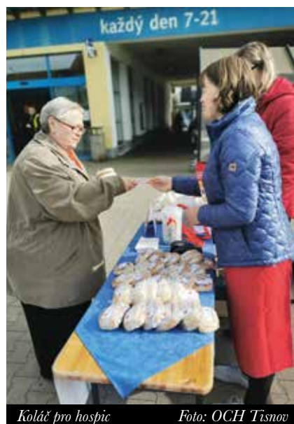
Koláč pro hospic

rity. Přijďte si za námi vyrobit něco pěkného pro vaše blízké, pro osamělé lidi z vašeho okolí nebo pro klienty našich služeb. Pokud vás tento vlastnoručně vyrobený dárek přivede