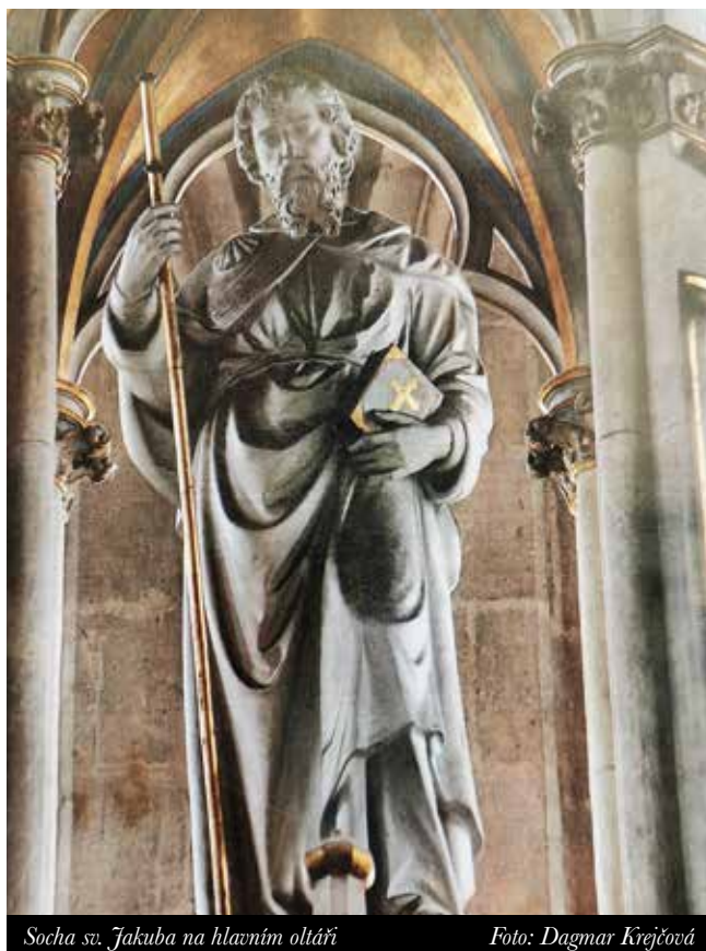
Socha sv. Jakuba na hlavním oltáři

Již od počátku 13. století existoval kolem kostela hřbitov. Umístění hřbitova uvnitř hradeb neumožňovalo jeho další rozšiřování a jeho kapacita brzy přestala stačit potřebám rostoucího města. Z tohoto důvodu zde byl zaveden tzv. výměnný systém pohřbívání, což znamenalo, že po 10–12 letech od pohřbu byl hrob otevřen, ostatky vyjmu-