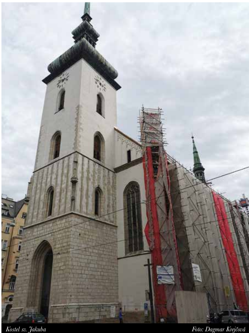
Kostel sv. Jakuba