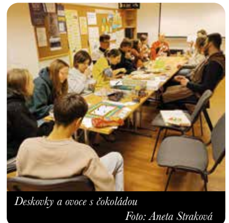
Deskovky a ovoce s čokoládou