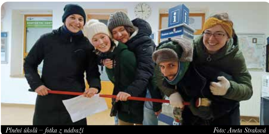
Plnění úkolů – fotka z nádraží