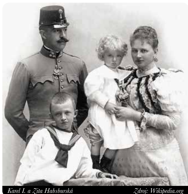
Karel I. a Zita Habsburská

Jejich sňatek proběhl 21. října 1911 rovněž ve Schwarzau. Karel pak působil u jednotky v Brandýse a Zita s rodinou se v roce 1913 usadila ve Vídni-Meidlingu. Tou dobou už bylo na světě jejich první dítě, syn Oto František Josef. Děti se jim v následujících letech narodilo pak ještě dalších 7, dohromady 5 synů a 3 dcery.