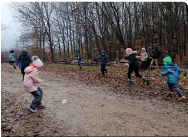
Hra na Klucanině

Pak už jsme vyrazili zpět na faru, kde jsme se občerstvili, vedoucí uvařili čaj i horké kakao, které jsme si vychutnali u promítání dvou krátkých inspirativních příběhů.