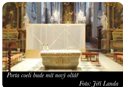
Porta coeli bude mít nový oltář

Jak jste si mohli všimnout už na začátku doby postní, liturgický prostor jsme provizorně přestěhovali blíže k hlavní lodi, aby se na nových oltářních stupních mohl postavit nový oltář a ambon, a také do tohoto prostoru bude umístěn v ateliéru vyrobený nový procesní kříž a sedes. V tomto liturgickém provizoriu zůstaneme až do zasvěcení nového oltáře v polovině dubna, tedy i během velikonoční-