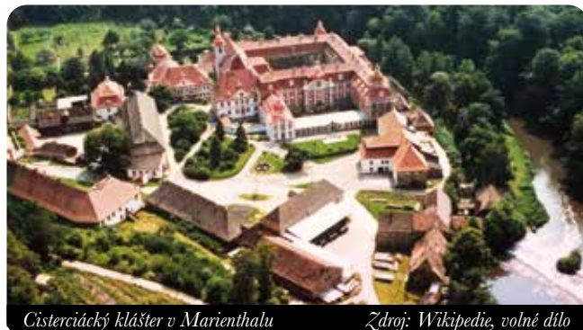
Cisterciácký klášter v Marienthalu