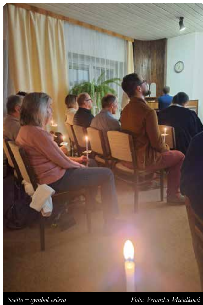
Světlo – symbol večera