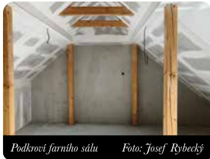
Podkroví farního sálu

S radostí píšu tyto řádky a doufám, že v dalším čísle se toho o opravách a stavbách moc nedočtete, protože už bude většina práce hotová. Pokračovat bude akorát svépomocná oprava místnosti v přízemí věže tišnovského kostela. A ještě nám zbývá pár drobností na kapli v Lomnici a pokračování postupné opravy kaple v Hradčanech.