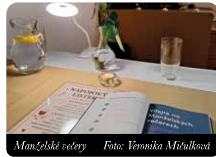
Manželské večery