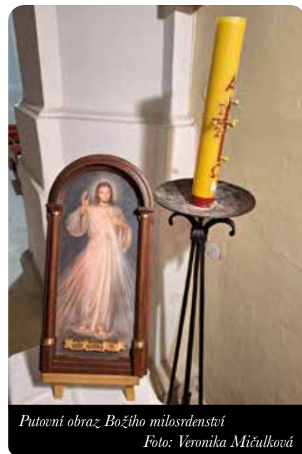
Putovní obraz Božího milosrdenství