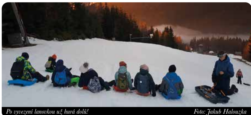
Po vyvezení lanovkou už hurá dolů!