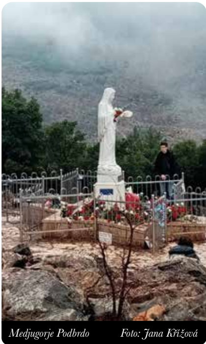
Medjugorje Podbrdo

Panna Marie, na ono místo se znovu vypravili. Tehdy s nimi Panna Maria již hovořila, proto se 25. červem 1981 v Medjugorji slaví jako den výročí zjevení . Od tohoto dne měli vizionáři každodenní zjevení, kdekoliv se nacházeli. Bohužel komunismus tomuto zjevování nepřál, proto byly děti vyslýchány a podrobeny mnoha lékařským vyšetřením. Jedno je však zjevné: pokud v jedné chvíli viděly Pannu Marii a hovořily s ní, nevní-