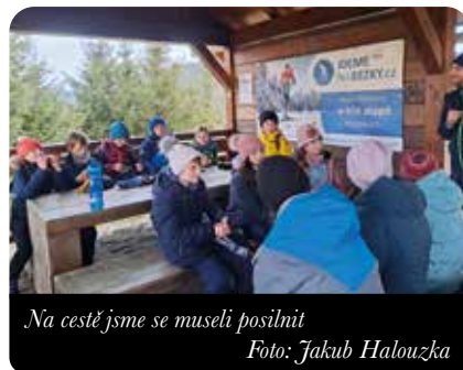
Na cestě jsme se museli posilnit

Na nedělní mši jsme vyrazili na významné poutní místo – Horu Matky Boží u Králíků. Z místní rozhledny jsme také zkoukli okolí a přemýšleli, kudy se vydat dál do Betléma. Melichar se rozhodl hledat Betlém na vlastní pěst směrem na jih. Kašpar a Baltazar byli naopak tohoto názoru, že bychom se měli vydat na sever. Děti následovaly Kašpara s Baltazarem. Jelikož i správný poutník by měl být schopen čas od času využívat dnešní technologie, tak celá skupina vyjela lanovkou na kopec Slamník. Ani zde jsme ale nenarazili na žádný náznak cesty do Betléma. Alespoň jízda na bobech do údolí však stála za to. Večer v zájezdním útulku nás opět čekala teplá večere, workshopy