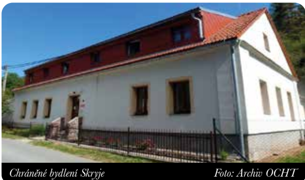
Chráněné bydlení Skryje